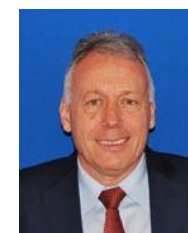
Borbély László Consilier de Stat, Coordonator Departament Dezvoltare durabilă, Guvernul României